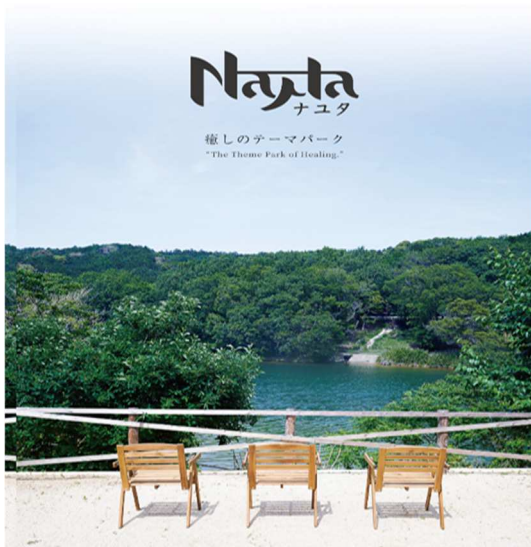
【2024年開業予定の温浴施設イメージ】