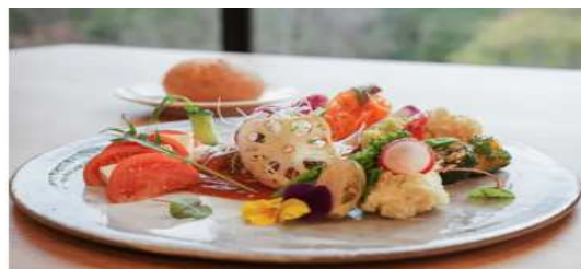
※2Fレストラン(ランチプレート)