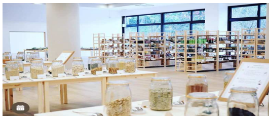
※1Fマルシェ(香辛料の量り売り等)