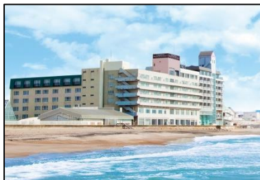
①イマジンホテル&リゾート函館