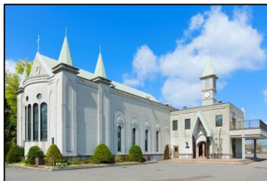
②函館聖マリア教会外観